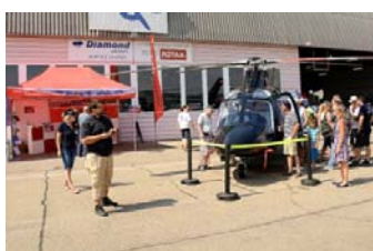
Überall in der Ausstellung konnte das faszinierte und begeisterte Publikum, vertieft in Gespräche mit den Besatzungen und den verschiedenen Anbietern von Dienstleistungen rund um den Helikopter, beobachtet werden

Es gibt wohl kaum eine ähnliche Heli-Veranstaltung, bei der das Publikum den Helikoptern so nah kommen kann und auch ausdrücklich durfte. Die Maschinen konnten mit den Sinnen erforscht werden. Anfassen und sehen, fühlen und riechen, den Helikopter wortwörtlich „hautnah“ erleben, das ist es, was das Heli-Weekend einmalig in der Schweiz macht.