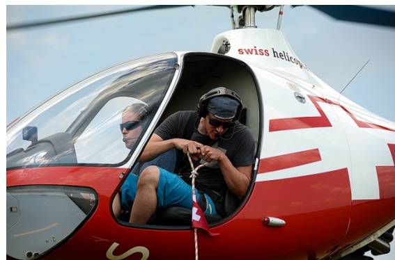
Kraft, Geschicklichkeit und eine gute Crew-Koordination sind gefragt

Ab dem Zeitpunkt vom Loslassen des Seils mit dem Eimer beim Tisch bis zum Abschluss der anschliessenden Präzisionslandung, war eine Zeit von maximal 30 Sekunden erlaubt. Wird diese Zeit überschritten, so werden pro Sekunde Strafpunkte angerechnet. An beiden Kufen wurde auch eine Markierung angebracht, welche nicht höher als 5 cm ab Grund sein durfte. Für jeden Zentimeter Abweichung auf jeder Seite zwischen der Landelinie und der Markierung waren ebenfalls Strafpunkte fällig. Es ist nach Reglement nur ein Landeversuch erlaubt und es dürfen keine Gleitlandungen gemacht werden.