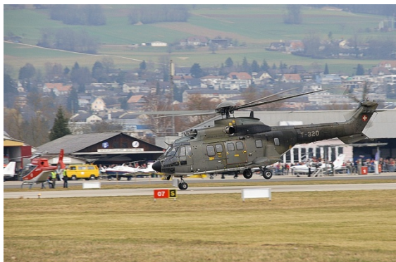
... und ein Höhepunkt des Heli-Weekends – Die Schweizer Luftwaffe und das Super Puma-Display