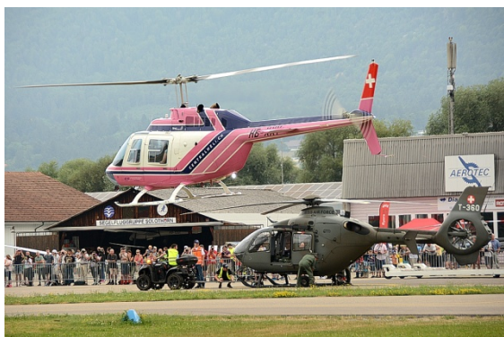
...und bunt präsentierten sich die Helikopter auch in diesem Jahr

Es gibt wohl kaum eine ähnliche Heli-Veranstaltung, bei der das Publikum den Helikoptern so nah kommen kann und auch ausdrücklich durfte. Die Maschinen konnten mit den Sinnen erforscht werden. Anfassen und sehen, fühlen und riechen, den Helikopter wortwörtlich „hautnah“ erleben, das ist es, was das Heli-Weekend einmalig in der Schweiz macht.