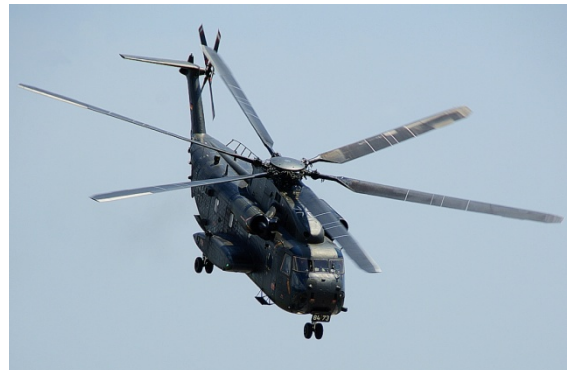
Weiterer Star und regelmässiger Teilnehmer am Heli-Weekend: Der Sikorsky CH-53 GA (dieses Jahr mit dem Kennzeichen 84+73) der Deutschen Bundesluftwaffe

Idee und Anlass zur Entstehung dieses Fly-In war, die Akzeptanz des Helikopters zu erhöhen. So wurde einer breiten Öffentlichkeit der Helikopter zugänglich gemacht und gezeigt, dass mit all seinen Einsatzmöglichkeiten nicht nur „Lärm“ und viel Wind gemacht wird, sondern der Helikopter auch ein sehr effizientes, praktisches und vielfach bewährtes Arbeits-, Transport- und Rettungsmittel ist. Um dies zu realisieren, bedarf es vieler UnterstützerInnen und HelferInnen, die sich schon weit im Vorfeld der eigentlichen Veranstaltung in der aufwendigen Organisation und Umsetzung engagieren.