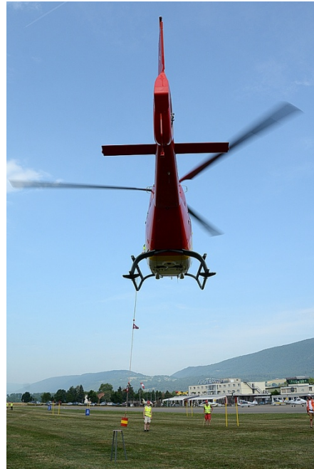
Das Team „WerniWerni“ im Rückwärts-Anflug auf den Tisch

Für beide Wettbewerbe wurden an den Hubschraubern die Türen auf der Seite der Co-Piloten komplett ausgebaut. Auf der Pilotenseite blieben die Türen bei beiden Wettbewerben geschlossen und es waren weder Bubble-Doors noch Lastenspiegel oder ähnliche Vorrichtungen und Sichthilfen zur Verbesserung der Pilotensicht erlaubt und mussten gegebenenfalls demontiert werden. Im Flug durch den Parcours ist die Sicht nach vorne sehr eingeschränkt. Der Pilot sieht gerade oder schräg vor sich das nächste Tor, das er anfliegen muss, aber irgendwann verschwindet es aus seinem Blickfeld und er ist vollständig auf die Anweisungen des Co-Piloten angewiesen. Der Einsatz von Auto-Piloten, Schwebehilfen oder Radar- und Funkhöhenmesser war ebenfalls untersagt und ein Gebrauch hätte die sofortige Disqualifikation der Crew nach sich gezogen.