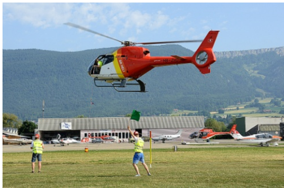
Alles im grünen Bereich: Das Team „WerniWerni“ mit der EC 120 B Colibri HB-ZHD beim erfolgreichen Durchflug des ersten Tores im Slalom-Parcours

Als erster Wettbewerb stand die „Slalom Challenge“ auf dem Programm. Hierbei galt es einen mit Wasser gefüllten Eimer, der auf der Innenseite über eine Markierung verfügt, um die während des Fluges verlorene Menge Wasser zu kontrollieren, möglichst ohne Berührung und in der richtigen Höhe durch die unterschiedlich breit gesteckten zehn Tore unter der Zeitvorgabe von 4 Minuten und 18 Sekunden zu manövrieren. Sowohl beim Slalom wie auch beim Fendern starteten die Teams jeden Wettbewerb mit 300 Punkten. Die Zeitnahme begann sobald das erste Tor passiert wurde und gestoppt, wenn die Präzisionslandung abgeschlossen war. Verschiedene Tore mussten dabei zum Teil auch rückwärts durch- bzw. angefliegen werden. Der Eimer wird vom Co-Piloten am Ende eines sechs Meter langen Seils gehalten. Die Hand oder die Hände, welche das Seil festhalten, müssen vom Start bis zum Absetzen des Eimers immer sichtbar sein. Das Seil darf nur in seiner kompletten Länge benutzt werden und jeglicher Regelverstoss wird mit Strafpunkten geahndet.