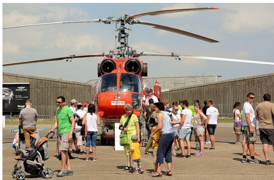
Einer der Stars und Publikumsmagnete war der russische Grosshelikopter Kamov KA-32 HB-XKE der Heliswiss International aus Bern-Belp

Der Regionalflugplatz in Grenchen war somit für einmal Mehr an diesem Wochenende das „Mekka“ für Helikopter- und Flugbegeisterte Zuschauer aller Altersklassen, die in Rekordzahl auf das Ausstellungsgelände pilgerten, was nicht zuletzt auch dem Anlass entsprechend schönem Wetter geschuldet war.