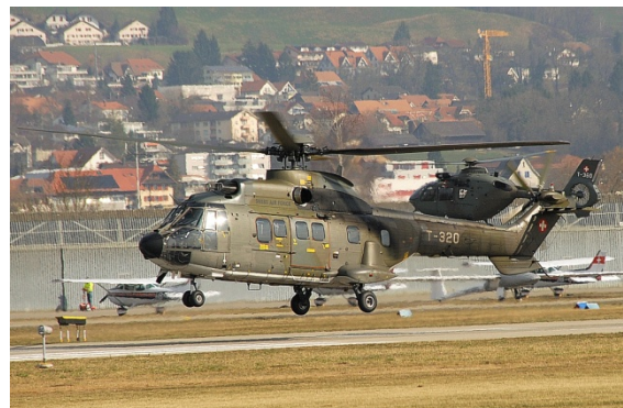
Alljährliche Gäste...

Von Beginn an im Jahre 2008 war das Heli-Weekend als offenes Fly-In organisiert, zu dem alle Helikopter und ihre Besatzungen willkommen waren. Durch das stetig steigende Interesse seitens des Publikums und der Teilnehmer wurde das Heli-Weekend zum grössten Heli-Treffen der Schweiz. Speziell eingeladen vom OK wurden Helikopter, die auf Nachfrage aus dem Bereich der Interessierten und dem Publikum gewünscht wurden, was u.a. auch die Qualität dieses Events ausmachte. So konnten im Laufe der Jahre viele verschiedene Helikopter mit ihren Besatzungen aus dem In- und Ausland in Grenchen begrüsst werden.