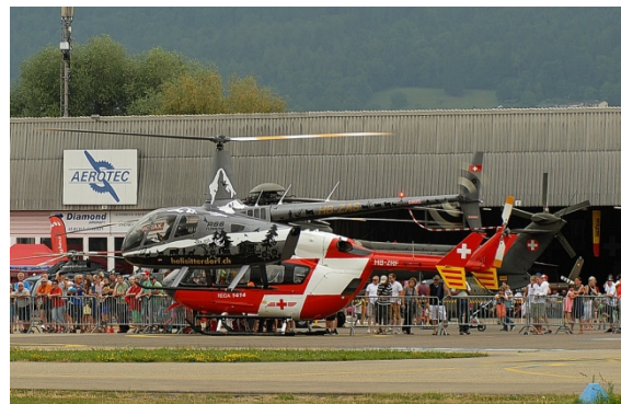
Reg(a)ler Flug- und Zuschauerbetrieb herrschte schon am frühen Vormittag des ersten Veranstaltungstages