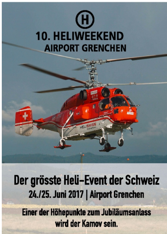
Einladungsplakat zur 10. Jubiläumsausgabe des Heli-Weekends 2017