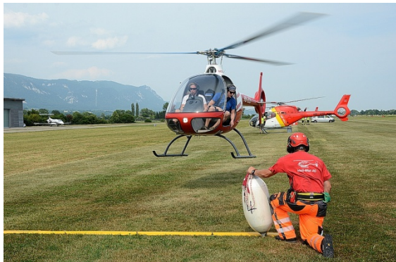
Das Team „Cabri“ im Anflug auf die Vorbereitungsline zur Übergabe des 4er-Fender (-> vier Meter Seillänge) durch den Flughelfer

Beim „Fendern“ geht es darum, 3 Fender mit Seilen, die unterschiedlich lang sind (4, 6 und 8 Meter), in 3 Fässer und 3 Kegel, die an einem sechs Meter langem Seil hängen, in ein 40x40 Zentimeter grosses Loch des sogenannten "Dog House", zu versenken. Auf dem Weg im Parcours zu den Fässern und dem „Dog House“ mussten vorher erst drei Tore, ähnlich wie im Slalom-Wettbewerb, fehlerfrei mit den Fendern passiert werden. Die Startreihenfolge der Teams, sowie zusätzlich die Reihenfolge der unterschiedlichen Seillängen an den Fendern und die Reihenfolge der Fässer (A, B und C) wurden während des Crew Briefings am Samstag ausgelost.