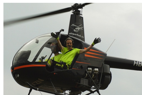
Grosse Freude über einen gelungenen Lauf in einem spannenden Wettbewerb

Allein in Hamburg gab es mehr als dreihundert Todesopfer, unzählige wurden obdachlos und tausende von zerstörten Häusern und Existenzen waren zu beklagen. Helmut Schmidt als damaliger Innensenator und damit auch Leiter der Polizeibehörde der Hansestadt, und späterer Deutscher Bundeskanzler, erlangte hier als innovativer Krisenmanager sehr grosse Popularität. Diese Popularität übertrug sich auch auf den Helikopter, als auch bis heute noch vielfach lebensrettendes Einsatzmittel, woraus damals auch die Idee der Helikopter-Wettbewerbe, wie man sie in ihrer heutigen Form kennt, entstand. (cw)