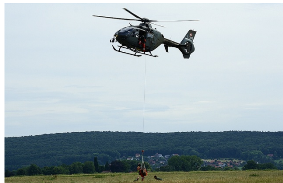
Deckungsgleiche Aufgaben und hoher Anspruch an die Präzision in der Luftrettung wie auch im sportlichen Wettbewerb

Angesichts dieses besonderen Wettbewerbes herrschte auch ein grosses mediales Interesse. Es berichteten lokale, regionale und auch landesweite Medien über den Anlass in Wort, Ton und Bild. Dies kommt vor allem der Akzeptanz von Helikoptern in der Öffentlichkeit zugute, wurde hier auch gezeigt, dass Helikopter viel mehr als „nur“ Lärm machen und Staub aufwirbeln. Hier wurde im sportlichen Wettkampf und im kameradschaftlichen Miteinander gezeigt, wozu ein Helikopter und seine Besatzung in der Lage sind, haben diese Meisterschaften doch ihren Ursprung in einer der ersten und grössten Luftrettungs- und Evakuierungseinsätze mit Helikoptern in der jüngeren Geschichte bei der schweren Sturmflut an der Nordsee im Jahre 1962.