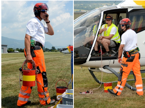
An der Vorbereitungsline übergab der Flughelfer den Eimer für den Slalom sowie die Fender für die „Fender Challenge“ an die Besatzungen

Die Startreihenfolge der Teams wurde vorher ausgelost und während dem Crew Briefing bekanntgegeben. Jede Crew konnte jeden Parcours (Slalom + Fender) zwei Mal hintereinander durchfliegen. Der im Wettbewerb jeweils bessere Lauf wurde in der Rangliste gewertet. Zum Start in den Parcours gaben nach erfolgter Vorbereitung an der „preparation line“ der Pilot oder Co-Pilot mit erhobenem Daumen das Signal, dass die Crew bereit ist. Der Flughelfer seinerseits prüfte die Umgebung, die Bereitschaft der Schiedsrichter und des Kurses und gab das Startsignal ebenfalls mit erhobenem Daumen. Erst auf sein Zeichen hin war der Start erlaubt.