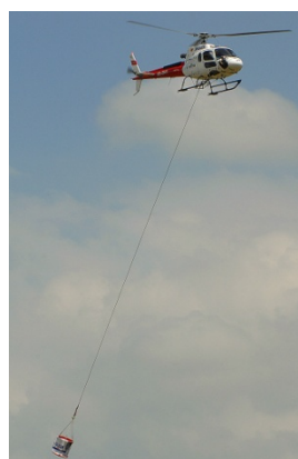
Mit Effizienz und Präzision zeigte die Air Glaciers im Unterlastfliegen die Möglichkeiten und die Agilität des Helikopters