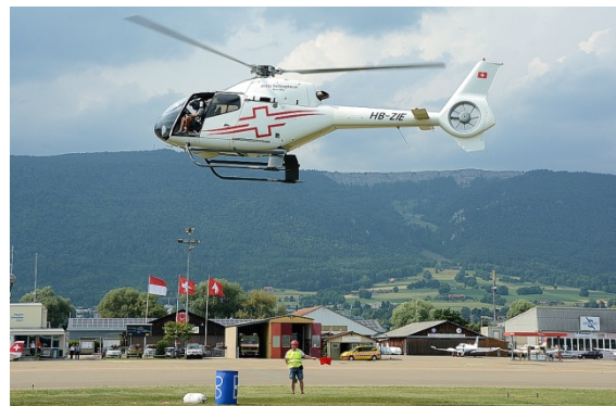
Die rote Flagge des Schiedsrichters zeigt einen fehlerhaften Fender-Abwurf an

Ist auch diese Hürde genommen worden, galt es einen Kegel im „Dog House“ zu platzieren. Entsprechend dem Reglement, musste der Kegel komplett inkl. dem aufgerollten Seil auf der Co-Piloten-Seite sicher verstaut mitgeführt werden.