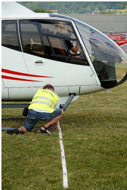
Zentimetergenaue Messung nach der Präzisionslandung

Nach Abschluss eines Durchgangs flog die Crew entweder zurück zur "preparation line" für den zweiten Lauf oder zurück zum Abstellfeld. Die nächsten folgenden Teilnehmer durften erst vom Abstellfeld in Richtung "preparation line" abheben, wenn der vorangegangene Teilnehmer dort sicher gelandet war. Wenn eine Crew einen Helikopter der vorangehenden Crew übernommen hat, so erfolgte die Übergabe auch auf dem Abstellfeld.