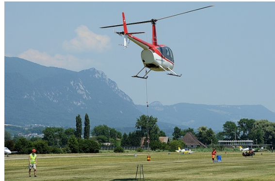
Der Robinson R-44 HB-ZDW im Schwebeflug über dem Tisch

gischen Verhältnisse und vor allem der Wind eine grosse Rolle für den Erfolg. Im Falle von zu starken Winden oder aus Sicherheitsgründen kann der Kurs angepasst werden. Wenn der Eimer ausserhalb eines Radius von 5 m vom Tische abgeworfen wird oder verloren geht, wird das Team für diesen Lauf mit null Punkten gewertet.