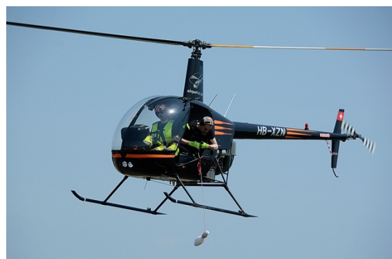
Der Kegel am 6-Meterseil wird aus dem Helikopter gerollt

Ist auch diese Hürde genommen worden, galt es einen Kegel im „Dog House“ zu platzieren. Entsprechend dem Reglement, musste der Kegel komplett inkl. dem aufgerollten Seil auf der Co-Piloten-Seite sicher verstaut mitgeführt werden.