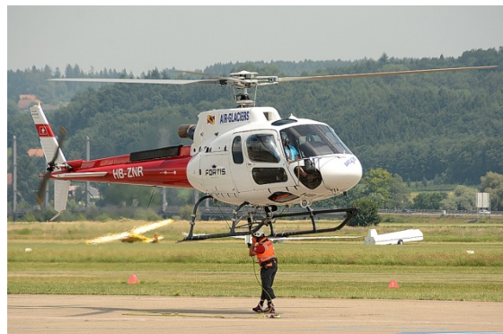
Beginn der Vorführung der Air Glaciers mit dem Einhängen des Transportseils am Helikopter durch den Flughelfer

Ein weiterer Höhepunkt neben dem eindrucksvollen Display des Super Puma der Schweizer Luftwaffe, war die Vorführung der Air Glaciers mit der AS 350 B-3e HB-ZNR im Arbeitseinsatz mit Aussenlast-Transporten.