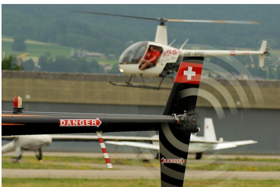
Taxi-Bewegungen zwischen Abstellfeld und Wettbewerbsbereich

Nach Abschluss eines Durchgangs flog die Crew entweder zurück zur "preparation line" für den zweiten Lauf oder zurück zum Abstellfeld. Die nächsten folgenden Teilnehmer durften erst vom Abstellfeld in Richtung "preparation line" abheben, wenn der vorangegangene Teilnehmer dort sicher gelandet war. Wenn eine Crew einen Helikopter der vorangehenden Crew übernommen hat, so erfolgte die Übergabe auch auf dem Abstellfeld.