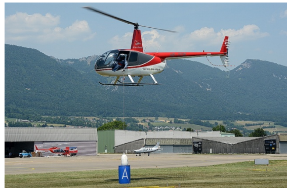
Das Team „Blitz Helicopter“ beim erfolgreichen Fender-Abwurf in das Fass

Hat die Crew die Tore erfolgreich gemeistert, musste der Fender gemäss der ausgelosten Reihenfolge im richtigen Fass deponiert werden. Wenn der Fender das Fass touchierte oder daneben abgeworfen wurde, wurden der Crew auch hierfür Strafpunkte berechnet.